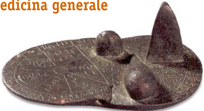
Fegato di Piacenza. Modellino in bronzo di fegato probabilmente ovino usato dagli aursupici per le loro divinazioni. Fine secondo - inizi primo secolo A.C. - Museo Archeologico di Piacenza

Castiglione del Lago 14 febbraio 2004 Palazzo della Corgna