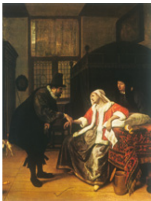
Jan Steen (1626-1679) La malata d'amore Monaco, Alte Pinakothek